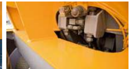
●ウインチ確認カメラ (オプション)