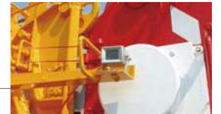
●右方確認カメラ (オプション)