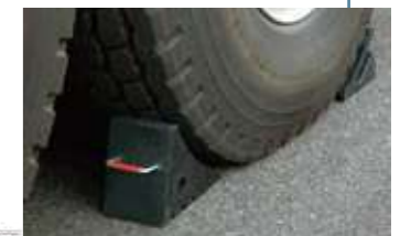
●車輪止め (オプション)