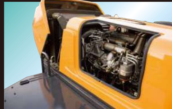
メンテナンス性を考慮したエンジンルーム

噴射圧力と噴射時期の制御自由度が高く、最適な燃料噴射を可能にします。省エネ+振動の少ない静かなエンジンです。