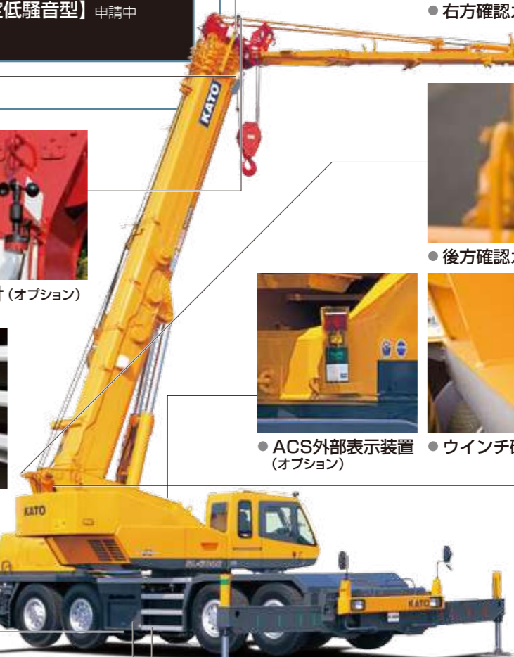
●アルミ製サイドステップ