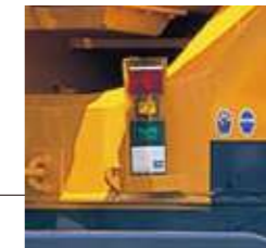
●ACS外部表示装置 (オプション)