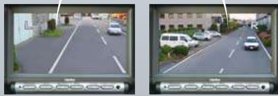
▲ 左方画面 ▲ 右方画面 (オプション)